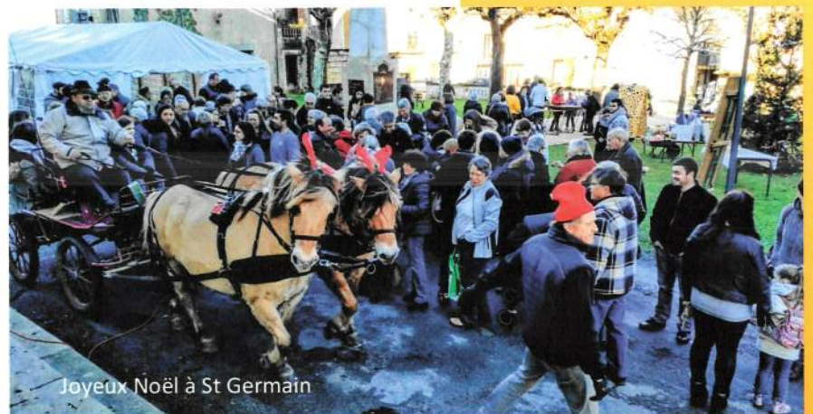
Joyeux Noël à St Germain