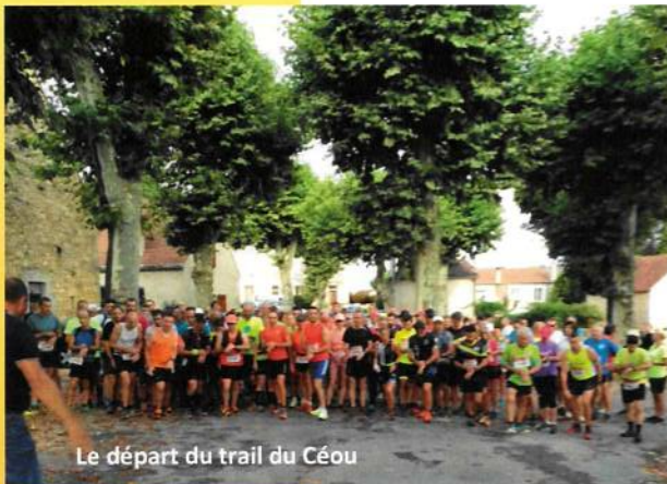
Le départ du trail du Céou