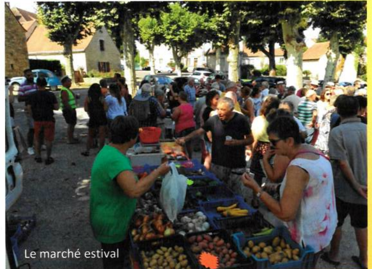
Le marché estival