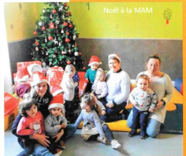
Noël à la MAM