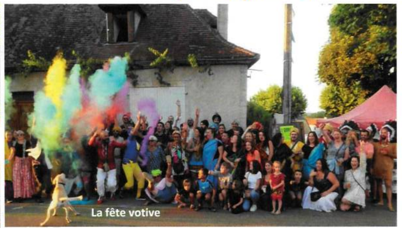
La fête votive