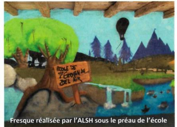
Fresque réalisée par l'ALSH sous le préau de l'école