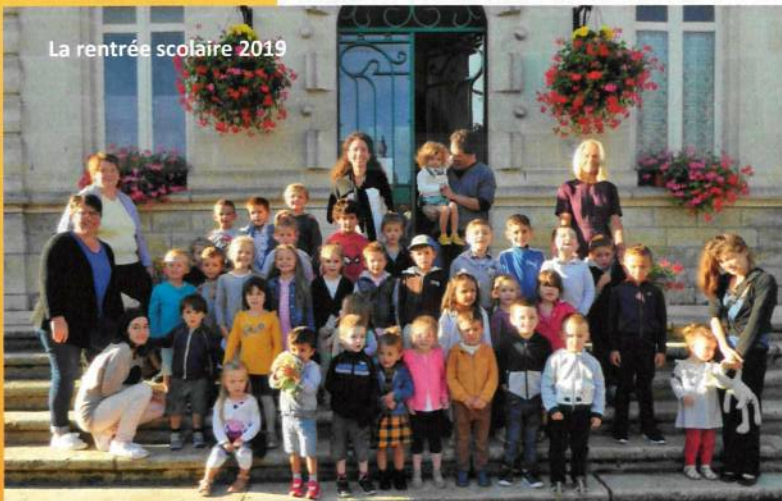
La rentrée scolaire 2019