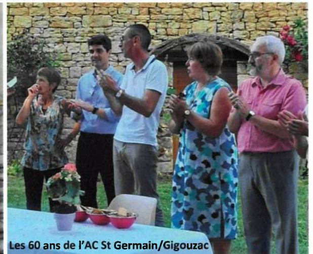
Les 60 ans de l'AC St Germain/Gigouzac