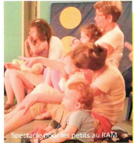
Spectacle pour les petits au RAM