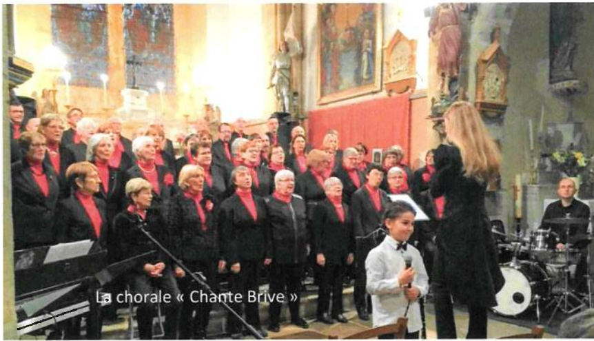
La chorale « Chante Brive »