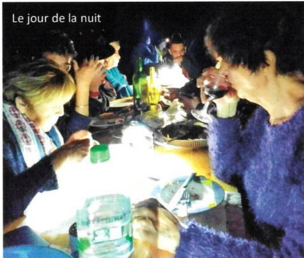
Le jour de la nuit