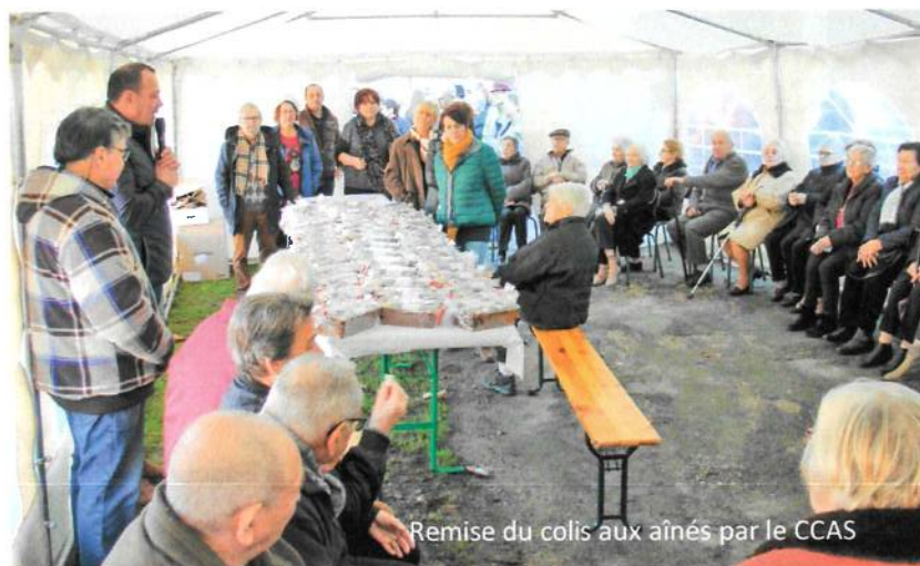
Remise du colis aux aînés par le CCAS